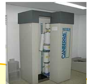
ホールボディ・カウンタ