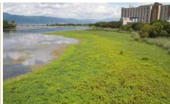
オオバナミズキンバイ