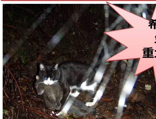
ノネコにくわえられたアマミノクロウサギ