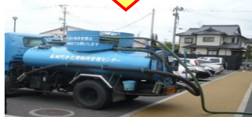
① 仮設トイレのし尿収集・運搬及び処分