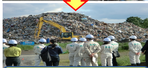
② 片付けごみの収集・運搬及び処分