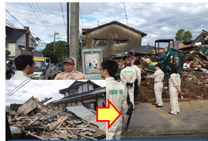
③ 損壊した家屋等の解体、がれきの収集・運搬及び処分