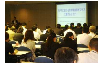
アジア水環境改善ビジネスセミナー (H26.5.13 於東京、約120名が参加)