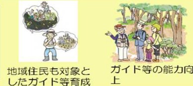
地域住民も対象としたガイド等育成

エコツアーの普及、推進の中核を担うガイド及びコーディネーターを育成 ・観光協会、宿泊業者等エコツーリズム推進の要となる地域住民も対象としたガイド、コーディネーターの育成 ・既存ガイド等の能力向上、連携の促進