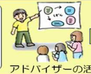
アドバイザーの活用

エコツーリズムの推進に伴う地域の課題解決への支援 ・エコツーリズムを活用した地域活性化に取り組む地域に対して、有識者をアドバイザーとして派遣 ・エコツーリズムの推進にあたっての課題の解決を支援