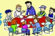
エコツーリズム推進全体構想の作成