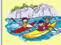
プログラムづくり

地域が取り組む魅力あるエコツアープログラムづくり等への支援 ・エコツーリズムに取り組む地域協議会等へ支援 ・地域協議会は多様な主体で構成（市町村の参加は必須） ・国が地域協議会に対しエコツーリズム推進全体構想の作成やプログラムづくり等に要する経費の2分の1を交付 ・1協議会あたりの交付額の上限は1000万円