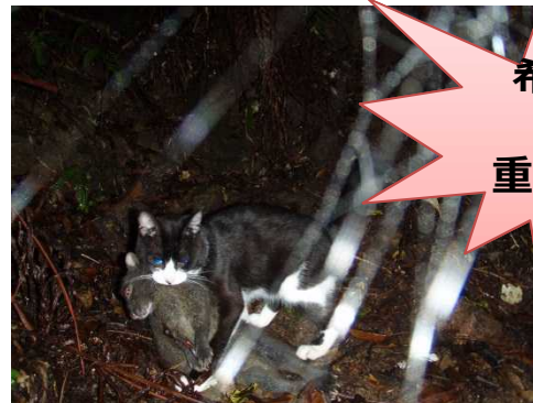
ノネコにくわえられたアマミノクロウサギ