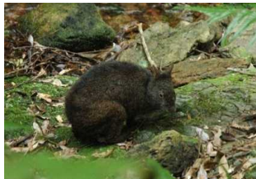
アマミノクロウサギ