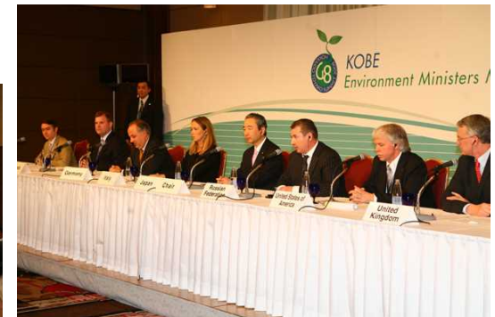
前回の日本で開催したG8神戸環境大臣会合の様子