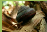
チチジマカタマイマイ (平成27年5月 新規指定種)