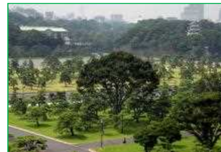
【皇居外苑】苑地維持管理