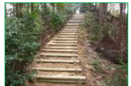
【東海自然歩道】登山道整備