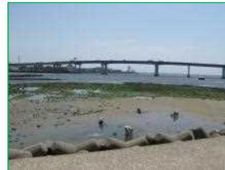
【国指定浜甲子園鳥獣保護区】保全事業