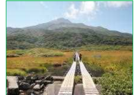
【鳥海国定公園】木道整備