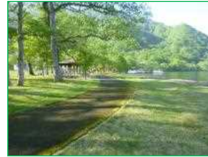
【十和田八幡平国立公園】園地整備