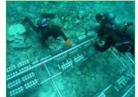
【西表石垣国立公園】自然再生事業