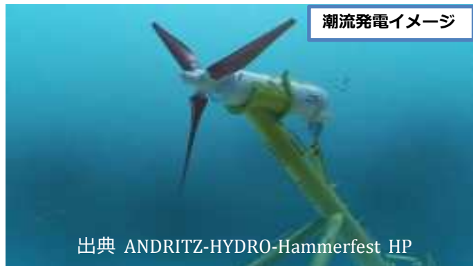
潮流発電イメージ