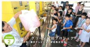
(福井県にて廃食油を回収しBDFを生成)