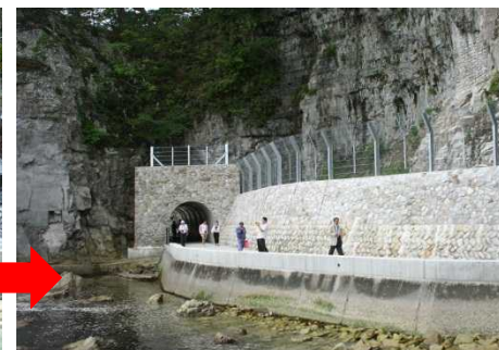
被災施設の復旧整備、供用開始(浄土ヶ浜海岸歩道)