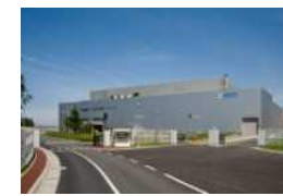
北海道（室蘭）事業所