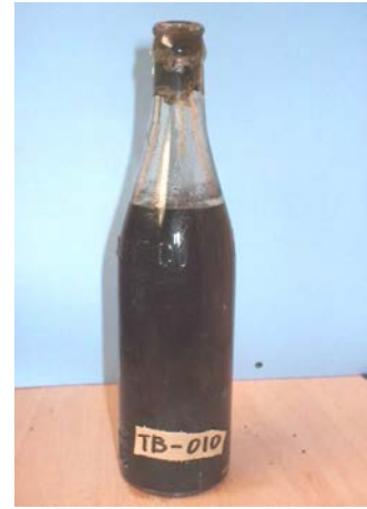
写真1 旧相模海軍工廠跡地内の工事現場から発見された旧軍の化学剤入りビール瓶の出土状況と発見されたビール瓶の一例