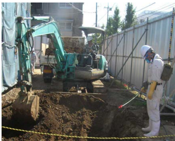
写真7 掘削作業時における安全確認調査実施状況（携帯型化学剤検知器による化学剤の有無の連続的な確認）