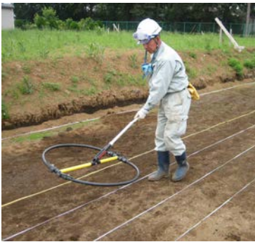
写真4 金属探査実施状況