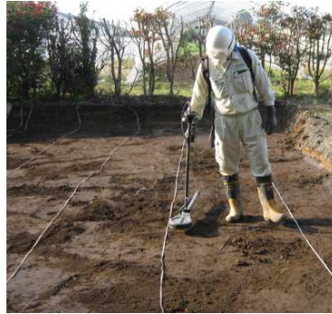
写真5 金属探査実施状況