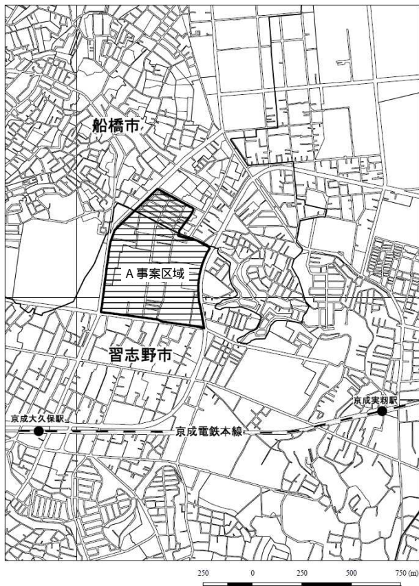
図1 - 2 旧陸軍習志野学校跡地 (千葉県習志野市・船橋市内)概略位置図