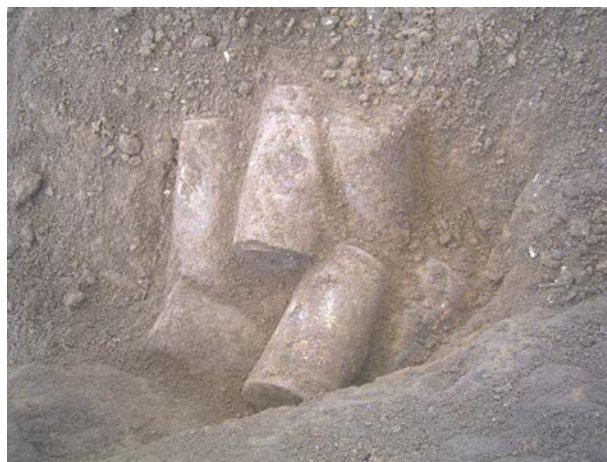
写真3 旧陸軍習志野学校跡地内から発見された旧軍の有毒発煙筒(あか筒)と推定される不審物