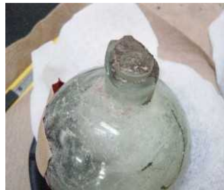
写真2 旧相模海軍工廠化学実験部跡地内の建設現場から発見された不審瓶の出土状況と発見された不審瓶の一例