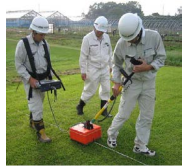
写真6 レーダー探査実施状況