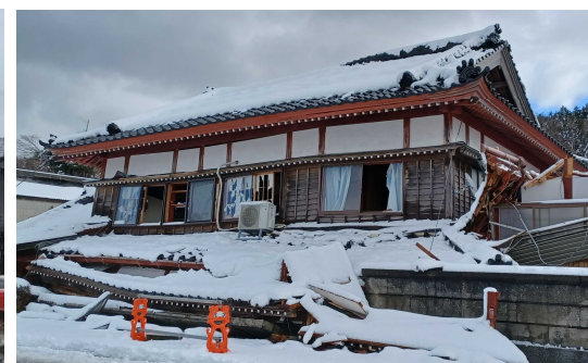
倒壊した家屋等の解体、撤去