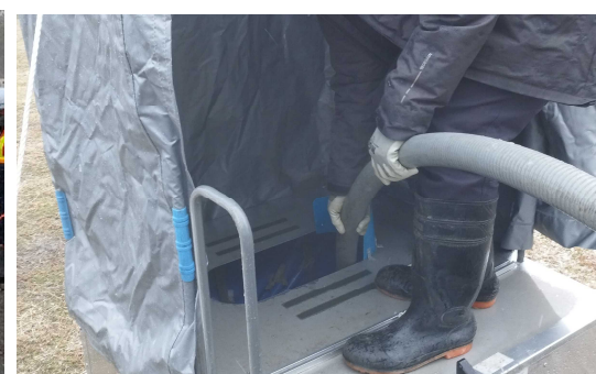
避難所の仮設トイレ等のし尿収集・運搬及び処分