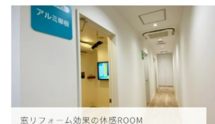
窓リフォーム効果の体感ROOM

LIXIL快適暮らし体験 住まいStudio東京( https://www.lixil.co.jp/s/sumai_studio/tokyo/ )