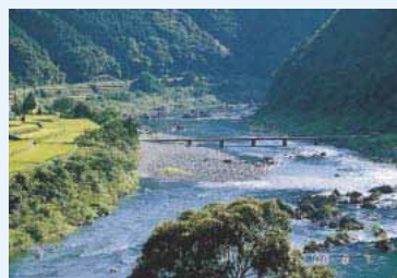
四万十川の沈下橋をわたる風

環境省は、日本各地の自然や生活、文化に根ざした香りのある地域を選定した“かおり風景”と全国各地で人々が地域のシンボルとして大切に、将来に残していきたいと願っている音の聞こえる環境（“音風景”）を選定している。景観を物質的な指標ではなく、かおりや音といった感覚的な指標で表現する取り組みの例である。