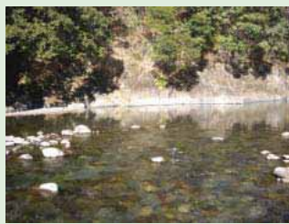
ごみがあるが多くはない (2)