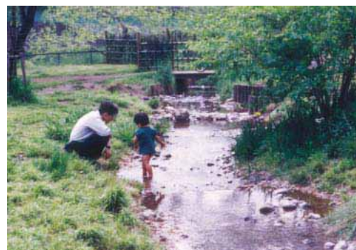
水遊びをする子供