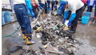
琵琶湖のプラスチックごみ実態把握調査(令和元年6月 赤野井湾)