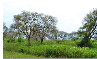
ヨシ群落内で巨木化したヤナギ

ヨシ群落の面積は概ね昭和30年代と同程度にまで回復したが、群落内のヤナギの巨木化等によるヨシの生育不良が見られる