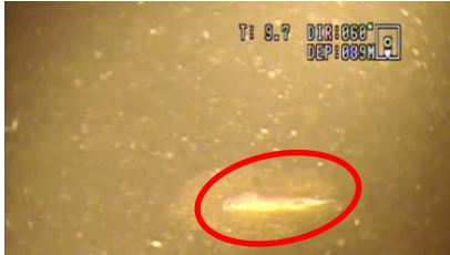
全層循環の未完了に伴う北湖深水層の負酸化によるイササの死亡(令和2年9月)