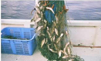
外来魚の集中駆除

外来魚の生息量は減少してきたものの、更なる対策の推進のため、多様な手法を組み合わせた防除を実施