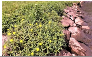
石組み護岸に生育したオオハナミスキンバイ

農地等での新たな生育の確認や石組み護岸やヨシ帯など機械駆除困難区域への対応が課題