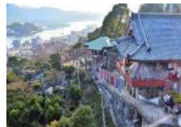
山々にこだまする鐘の音