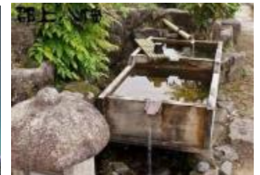
水路のせせらぎの音