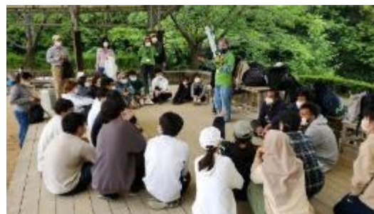
(山のグラウンドワーク後の交流会の様子)