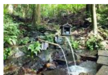
ホタルの里の水辺保全