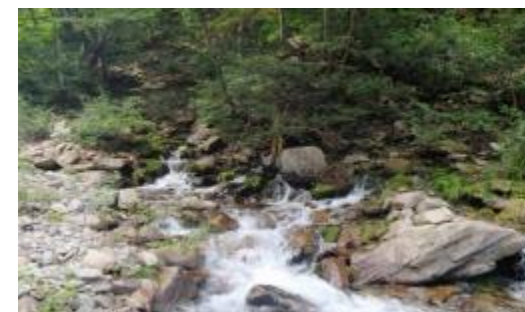
(大町市最大の水源「矢沢源流」)