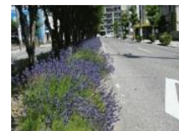
ラベンダー香る並木道