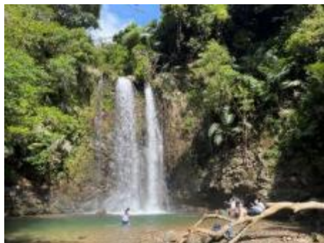
(平南川流域「ター滝」)