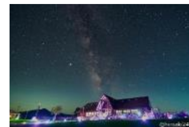
星空観察を通じた星空の保護