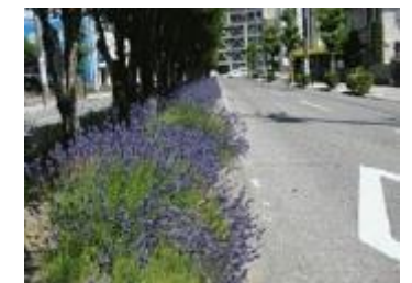
ラベンダー香る並木道