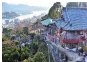
山々にこだまする鐘の音