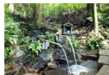
ホタルの里の水辺保全