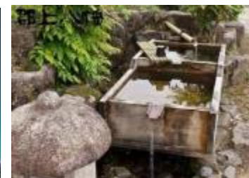
水路のせせらぎの音