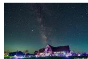
星空観察を通じた星空の保護