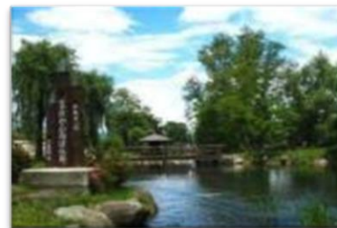
豊かな水辺の活用