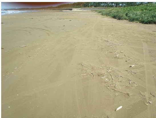
10 月 10 日