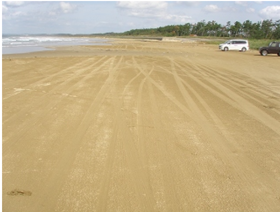
平成 19 年 9 月 26 日