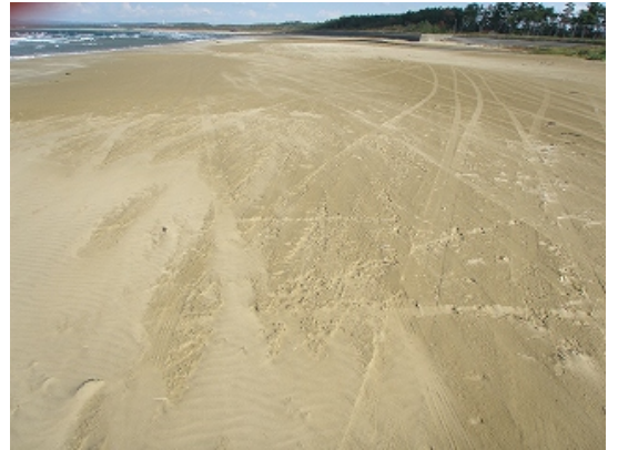
10 月 17 日