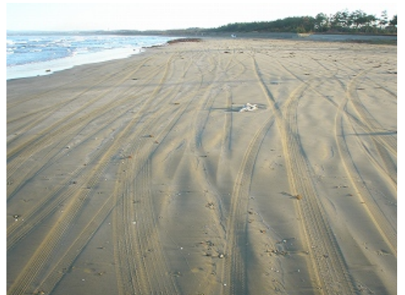
10 月 24 日 (第 1 回独自調査直前)