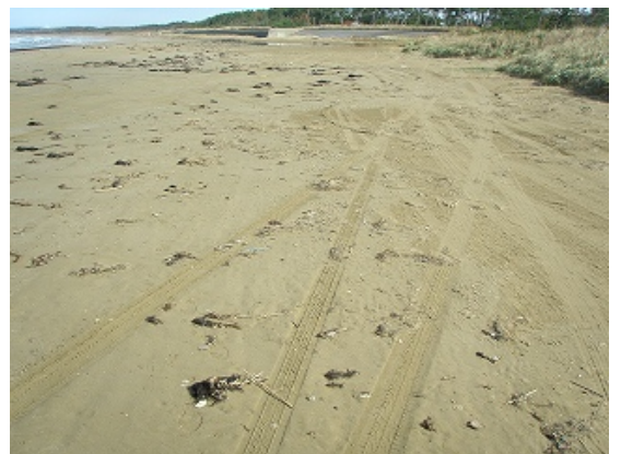
10 月 31 日 (第 1 回独自調査直後)