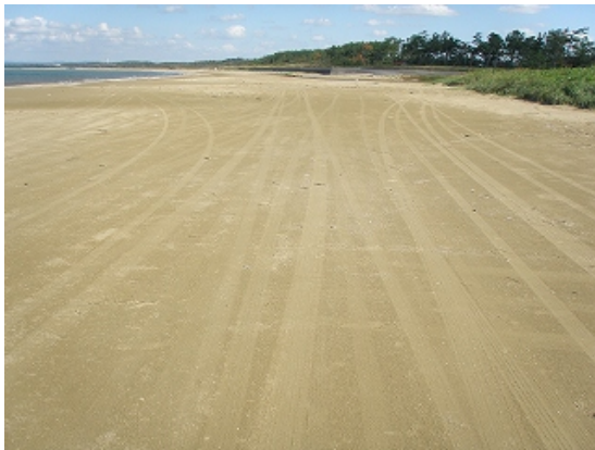
10 月 3 日