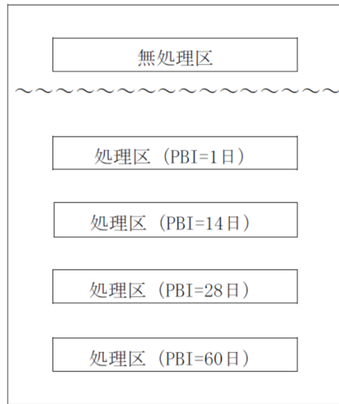
図 II-2-1 試験区のイメージ