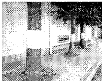
※ こも巻きの実施（マツ・ヒマラヤスギ）