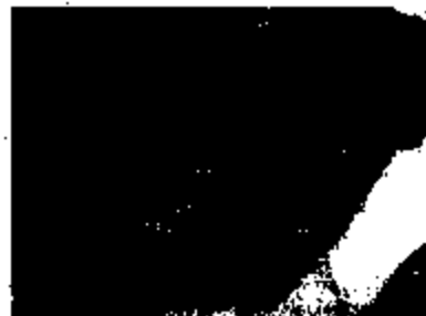
※ マイマイガ (コナラに発生)