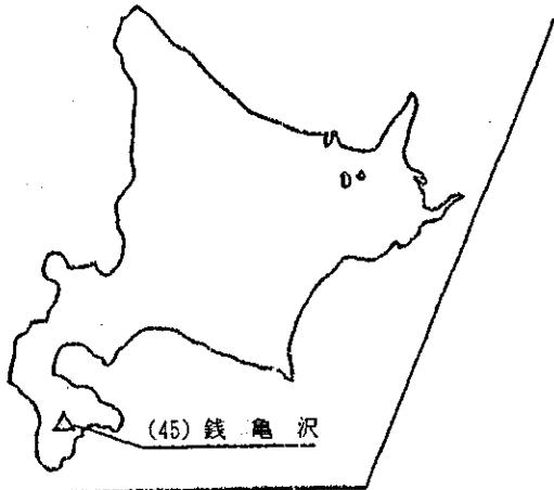
(参考) 農用地土壌汚染対策地域位置図