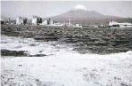
富士市、田子の浦の水質汚濁