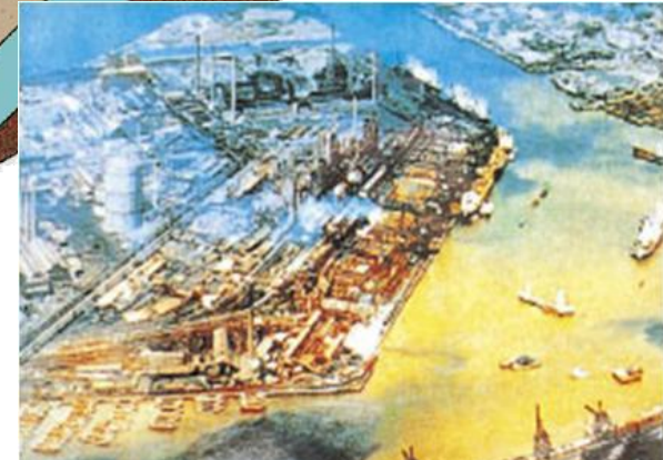
洞海湾の汚染