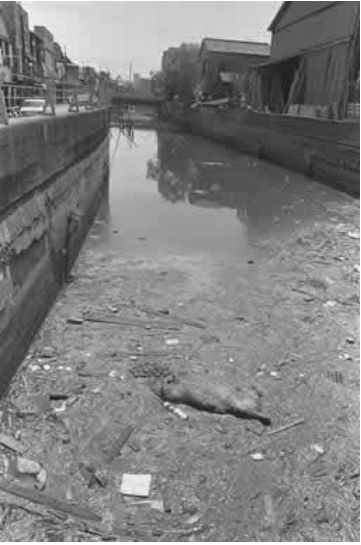
隅田川に流れ込む水路 (昭和46年頃)