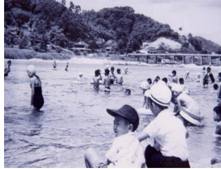
斐伊川での遊泳(木次町木次) (昭和41年頃)