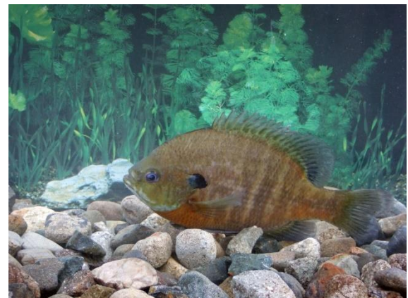
平成30年度に激減したブルーギル