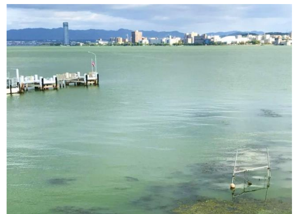
一面緑に染まった南湖（8月）