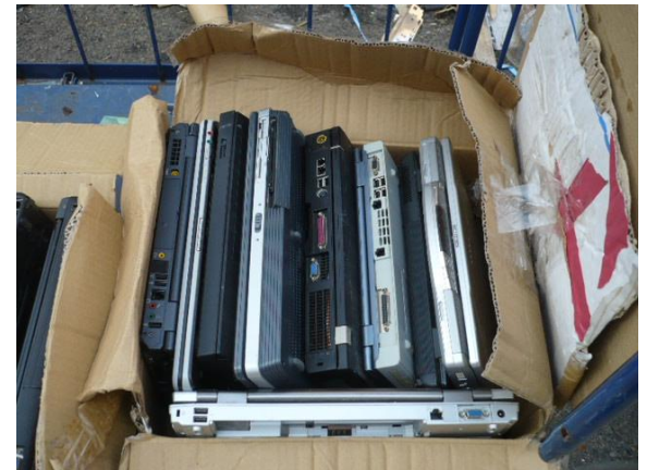
シップバックされた貨物の写真