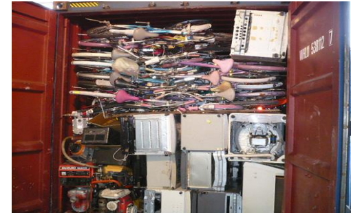
税関の貨物検査への立会い