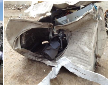
スクラップに混入していたエアコン室外機