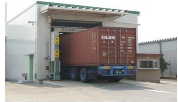
大型X線検査装置等による検査