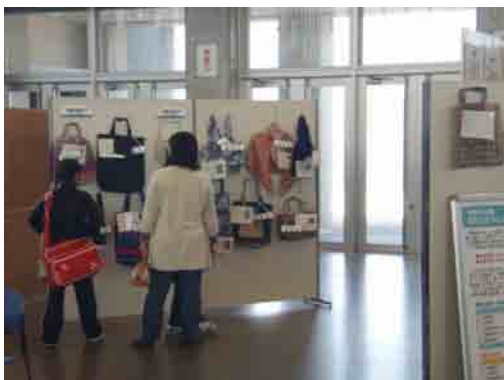
カサ利用、カサ以外部門の受賞作品