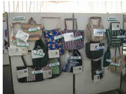
事業者、審査員特別賞等の受賞作品