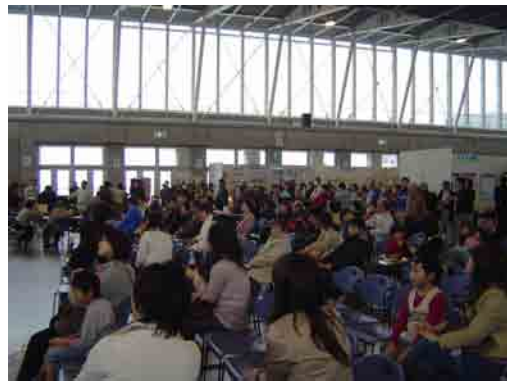
ごみの中から使用可能な家具類を 希望者にお譲りするリサイクル展(抽選会)