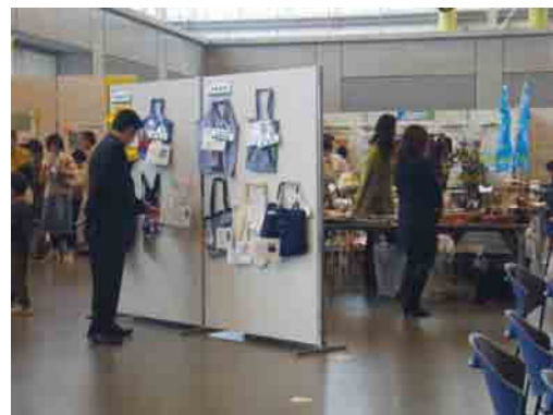
児童、生徒部門の受賞作品