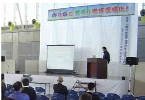
エコドライブ教室