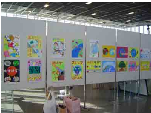
環境コンクール入賞者作品の展示