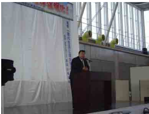
オープニングセレモニー 河瀬市長挨拶