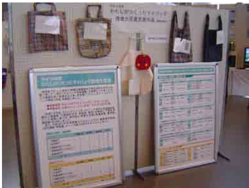
啓発パネル、福井県内の応募作品