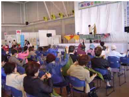
配布されたふろしきを使って客席で学習