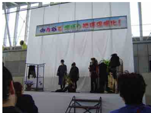
着物などをリメイクしたエコファッションショー