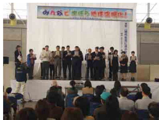
マイバッグ持参運動からはじめる 3 R 推進宣言