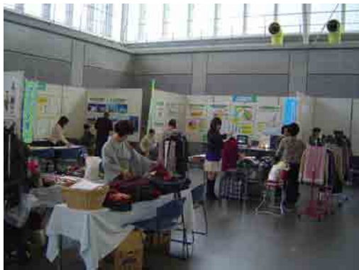
フリーマーケット、展示ブース