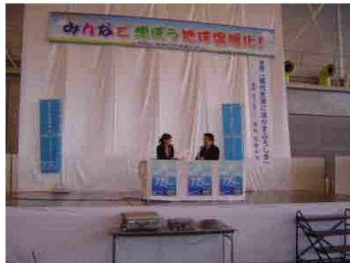
地元FM局の公開生放送