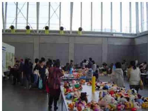
子供に人気の「かえっこバザール」