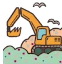
埋 う め 立 て 処 分 た 場 じ ょう