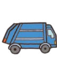
ごみ しゅうじゅう 集 しゃ 車