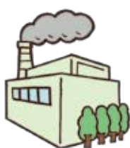
ごみ しゅり 処 しせつ 理 せつ 施 せつ 設