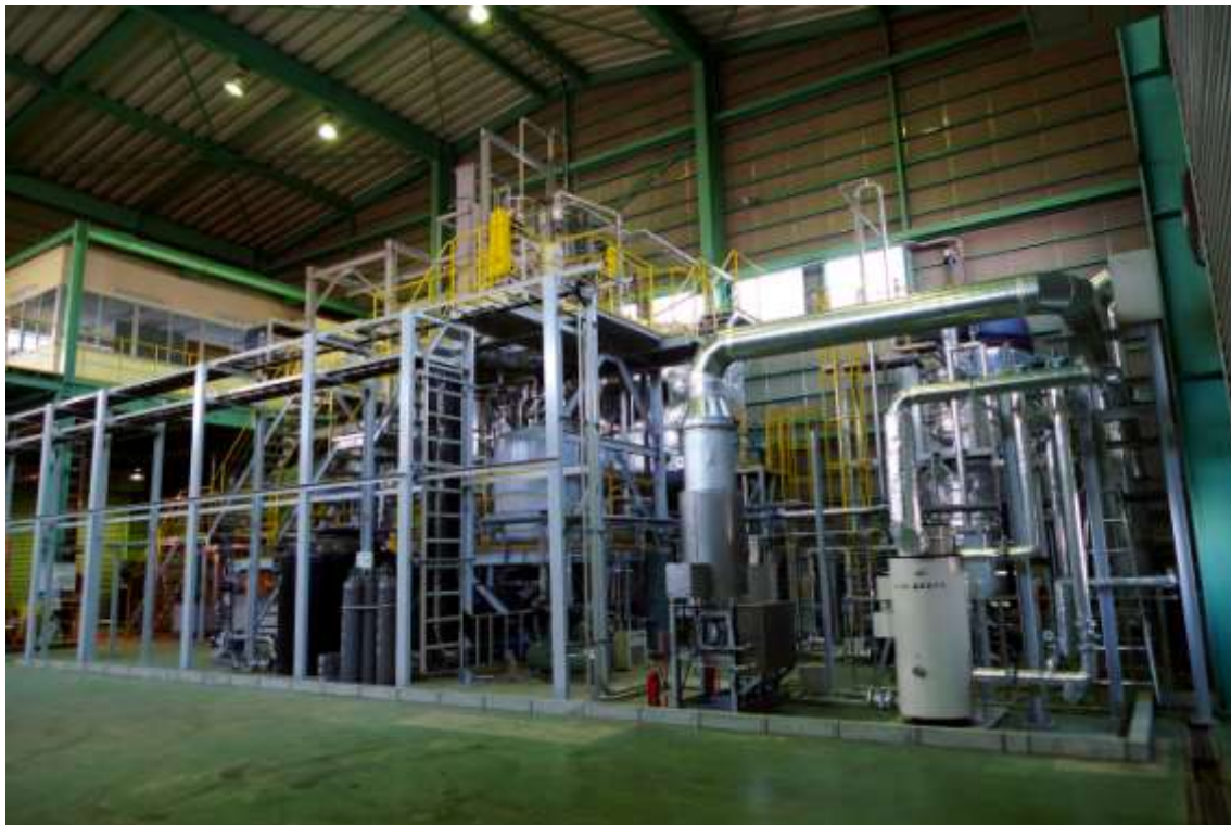
写真1 実証試験装置全景

本実証試験装置を、後述する検討を行った後、改造し、原料槽内に残留する異物の排出効果の確認を行った。