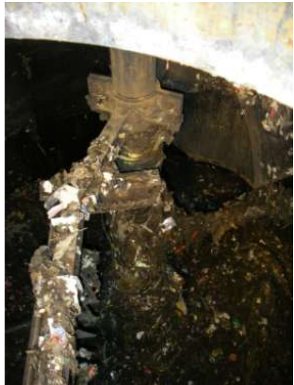
写真2 開放確認時の原料槽内部

本事業において、原料槽から排出される重量異物、軽量異物中に、バイオガス化可能な生ごみ、紙類などはほとんど見られず、バイオガス化率は90%と高い値であった。したがって、二槽循環式のバイオガス化システムの有効性は確認された。また、今年度改造した、異物排出機構により、原料槽の機密性の保持や可溶化に悪影響を与えず、異物の排出が可能となった。これらのことから、当初目的は達成したと考える。