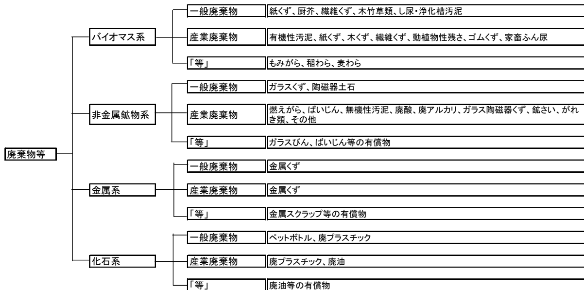
図 1-3-1 廃棄物等の区分

この4種類と通常用いられている廃棄物の区分との関係は、図 1-3-1 のとおりである。