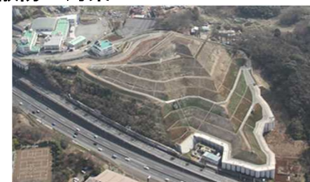
廃棄物崩落、飛散防止対策完了状況

擁壁を設置し、急傾斜部分を安定勾配に整形・覆土することにより、廃棄物の崩落・飛散を防止する。