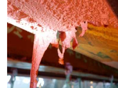
写真 橋梁塗膜除去工事の状況