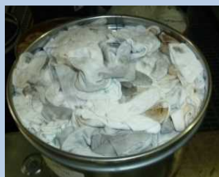
繊維くず（ウェス等）