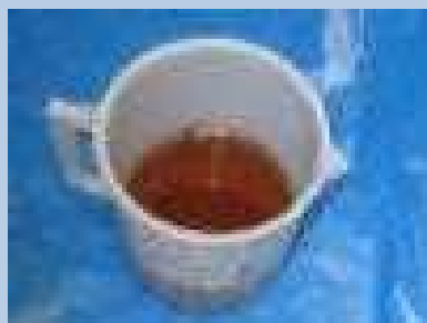
廃電気機器由来の 絶縁油（廃油）