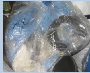
廃プラスチック類