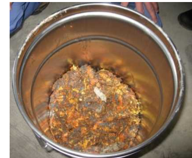
写真 保管中廃塗膜の例