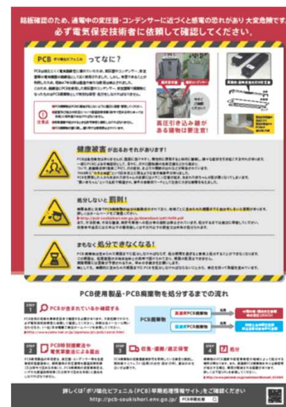
配布したビラ (A4サイズ両面)