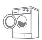
洗濯機・衣類乾燥機

有用な資源のほか、オゾン層の破壊や地球温暖化を引き起こすフロンガスや有害な鉛、水銀などを含んでいるため、法律に基づく適切なリサイクルが必要です。