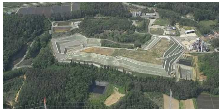
< 処分場概要 > 埋立処分量: 約101万t 許可容量 約85万m 3