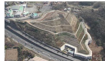
廃棄物崩落、飛散防止対策完了状況

擁壁を設置し、急傾斜部分を安定勾配に整形・覆土することにより、廃棄物の崩落・飛散を防止する。