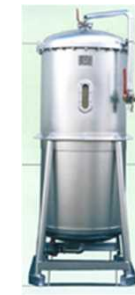
ホウ素吸着塔 (カートリッジ式)