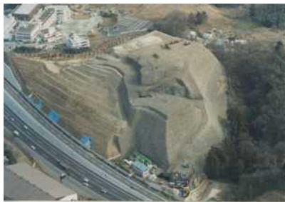
< 処分場概要 >

場内汚水が遮水の不備区域から処分場外に漏出し、周辺地下水の汚染のおそれが生じている。また、急勾配に廃棄物が積み上げられ、廃棄物が崩落することにより民家や道路等に流出する危険性がある。