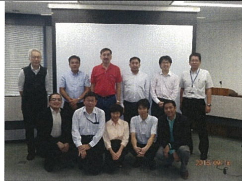
全スケジュール終了後の集合写真