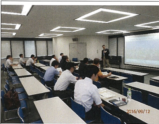
大阪市環境局での研修