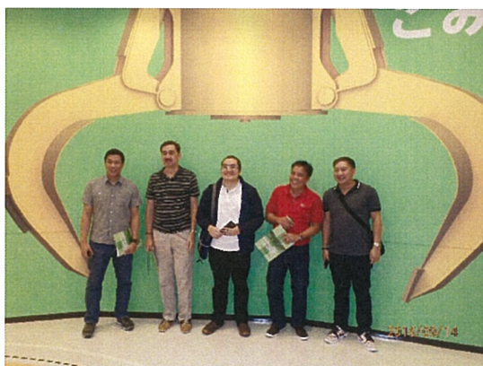
豊中市伊丹市クリーンランド見学

内容 (1) ビデオ見学の後、見学案内を担当している NPO 職員により場内を見学後、組合職員と質疑応答 (焼却施設説明内容) ・組合設立経緯 ・建設費：206 億円、発電設備：14,000kW、蒸気条件：4MPa、400℃ ・作業人員数、周辺住民との協調 ・焼却工場は 175ton/日×3 基の 525ton/日、ストーカ方式。発電機定格 14,000kW×1 基。蒸気条件 4MPa、400℃。 (リサイクル施設：豊中伊丹スリーR・センター施設内容) ・不燃ごみ破碎選別施設：低速回転破碎機、高速回転破碎機、粒度選別機、磁選機、アルミ選別機 ・プラスチック製容器包装選別施設：粒度選別機、手選別コンベア、圧縮梱包機 ・缶類選別施設：破除袋機、手選別機、圧縮機 ・びん類選別施設：手選別コンベア ・ペットボトル選別施設：穴明け機、手選別コンベア、圧縮梱包機 ・施設規模： 不燃ごみ類系統：53t/日、資源物系統：81ton/日 焼却施設・リサイクル施設とも特徴のある見学者設備を学んだ。