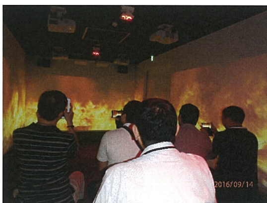
豊中市伊丹市クリーンランド見学