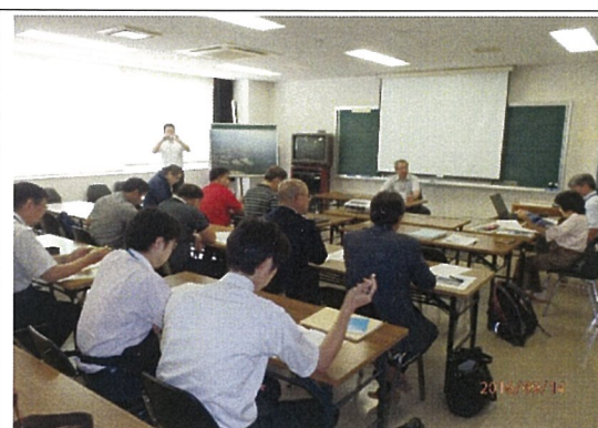
夢洲最終処分場説明