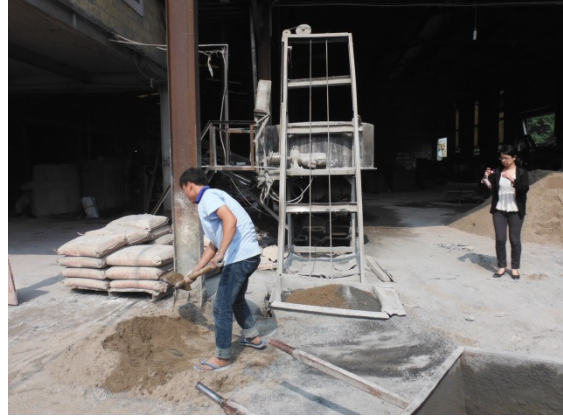
写真 添付①-24. 原料投入