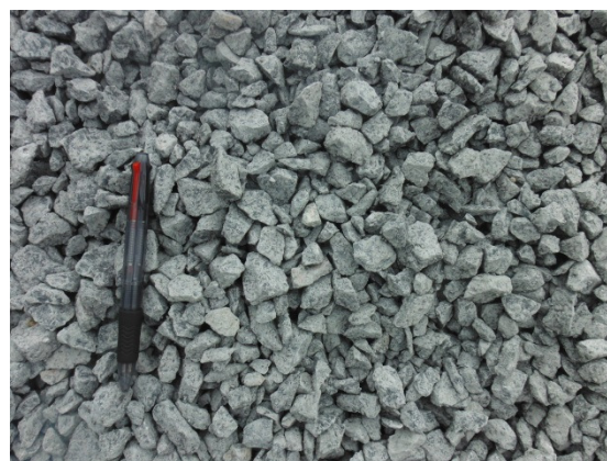
写真 添付①-18. 原料骨材