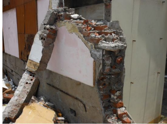
写真 添付①-2. 解体廃棄物