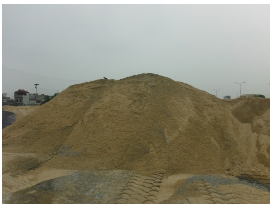
写真 添付①-17. 原料砂