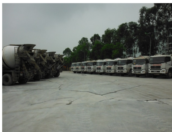
写真 添付①-16. 保有車両