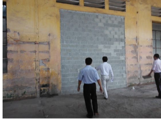
写真 添付①-10. リサイクル品使用ブロックの壁