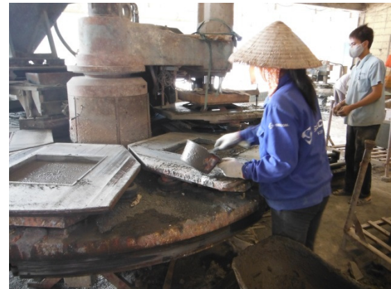
写真 添付①-26. タイル製造状況-2