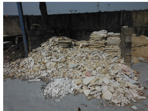
写真 添付①-28. 廃棄製品