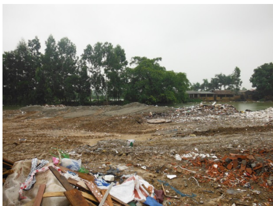
写真 添付①-13. 処分場状況-1

搬入物はスタッフにより分別されプラスチック、ビニール類、木材等は、地域最大の廃棄物埋立処分場である Nam Son 処分場等に搬出している。建廃運搬車輛のは搬入時間は夜間のみで、大小様々な車両で解体廃棄物が搬入される。本処分場はトラックスケールを有しており、年間の建廃の搬入量は、約 20 万～30 万 m 3 である。処分費用は 150 円/m 3 であり、収集運搬業者が処分場に支払っている。