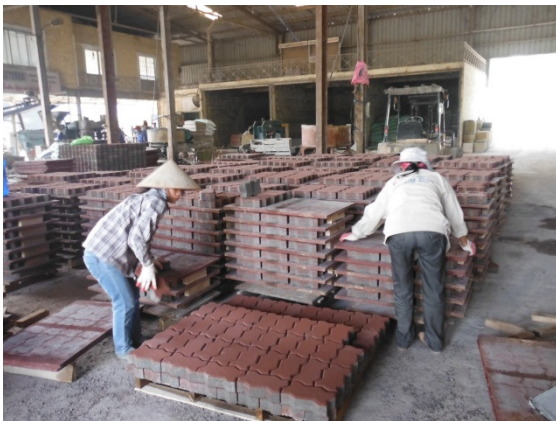
写真 添付①-27. ブロック製造状況