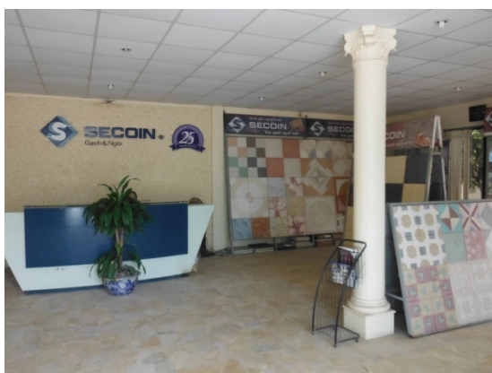
写真 添付①-21. SECOIN 社ロビー

製品の販売については、直販及び代理店を通しての販売を行っている。直販はゼネコンからの受注等であり、日本の ODA で行っている橋の建設にも利用されている。販売は、大手企業・大口顧客をターゲットとしており、不当に安く販売するところと戦うことはしていない。日本、オーストラリア、フィジー、モーリシャス諸島等に輸出をしており、輸出が 8 割を占める。