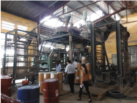
写真 添付①-9. ブロック製造設備