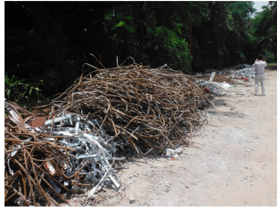
写真 添付①-4. 有価物分別状況