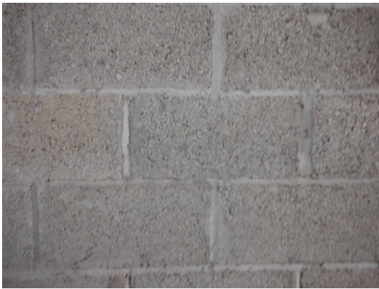
写真 添付①-11. リサイクル品使用ブロック (接写)