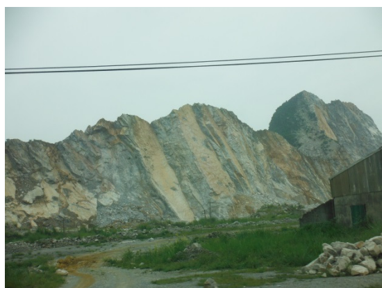
写真 添付①-19. 碎石場全景