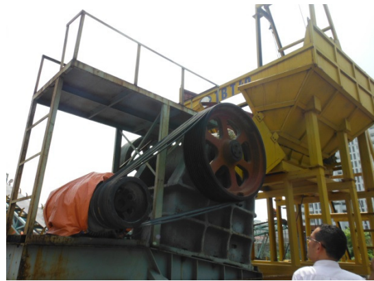
写真 添付①-6. 破砕機