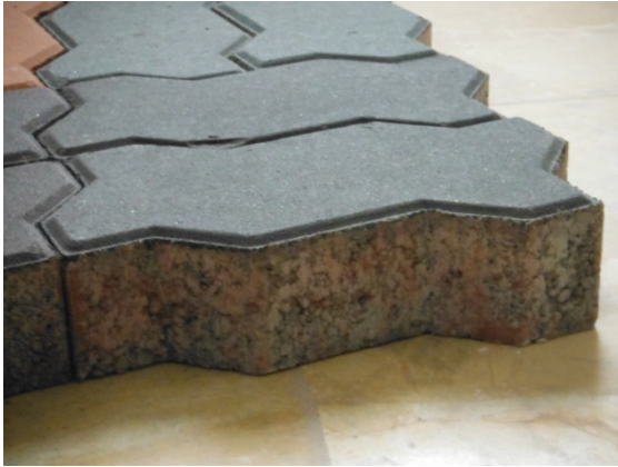
写真 添付①-23. 製品インターロッキング