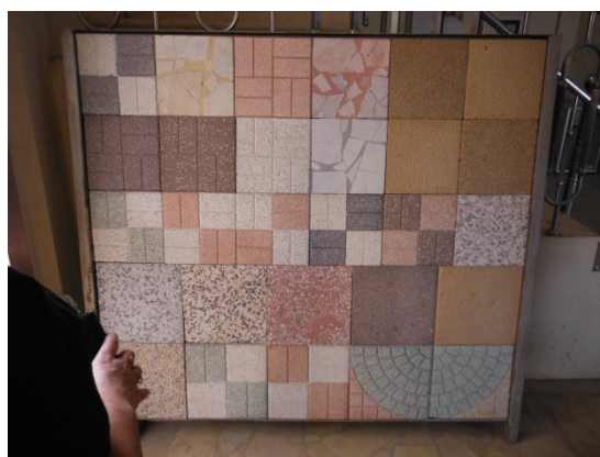
写真 添付①-22. 製品床タイル