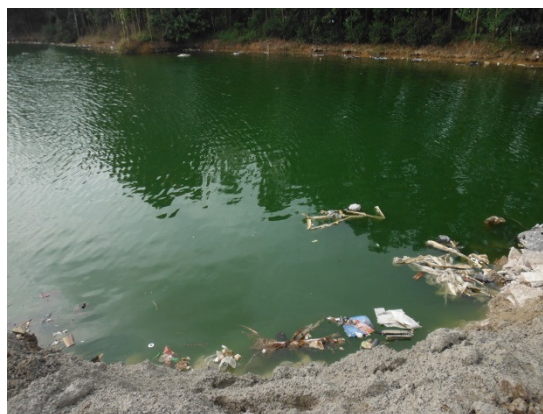
写真 添付①-14. 処分場状況-2