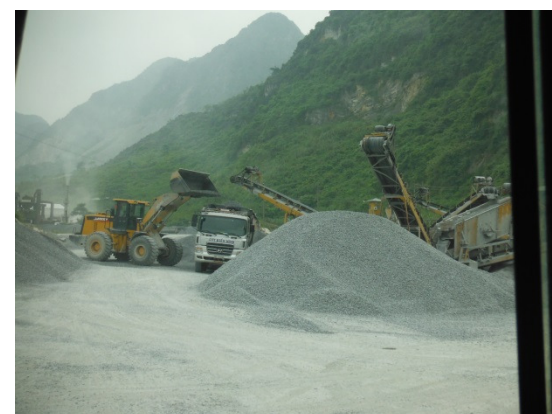
写真 添付①-20. 碎石製造プラント