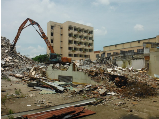
写真 添付①-1. 解体現場