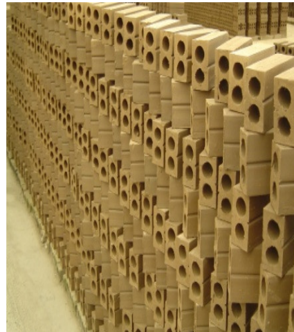
写真 添付①-29. レンガの乾燥・養生

レンガは粘土と石炭粉を混合して練混ぜ成形している。成形ラインは写真 2-19 の通り。成形後、写真 2-18 の通り、に乾燥・養生（3 日間乾燥）を終えた後、写真 20 に示す通りに焼成ラインの耐火レンガ上に 15 段程度積み上げ、焼成する。焼成温度が高くないため、製品内部の燃焼温度を上昇させる目的で混合された石炭粉が積上げて重なった部分において十分に焼成されず、炭化しているのが特徴的である。なお、このような炭化状態の製品についても特段外観不良として扱われることはなく、現場に搬入され一般的に使用されている。生産量は、3,000～4,000 個／時間、ピーク時で 5～7 万個／日の製造を行う。工場は、7 時間／日稼働である。また、焼成レンガの価格は 900～1,000 ドン（約 5 円）／個である。グレードの低いものは 600 ドン（約 3 円）／個である。