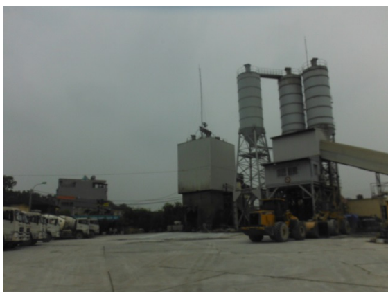
写真 添付①-15. コンクリート工場全景

れる。なお、山の種類によっては石灰石の質（純度、岩質）が異なるため、建設用以外の用途（食品、工業用品）にも出荷されている。