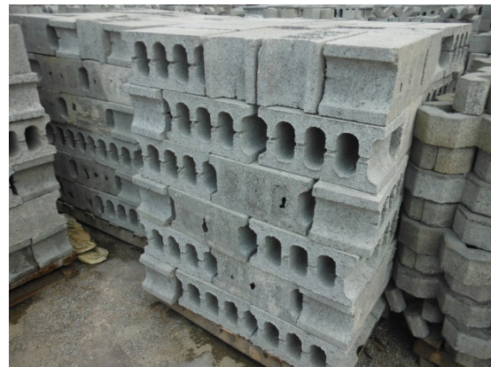
写真 添付①-12. ブロック製品