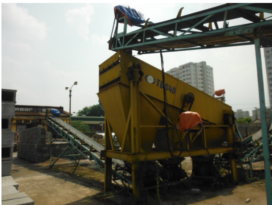
写真 添付①-7. 振動篩機