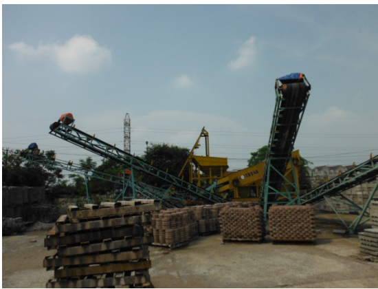
写真 添付①-5. プラント全景