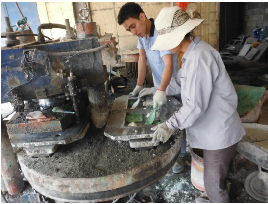
写真 添付①-25. タイル製造状況-1