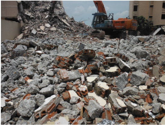
写真 添付①-3. 解体廃棄物