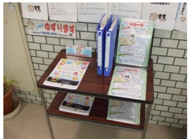
< 各種ちらしなど >