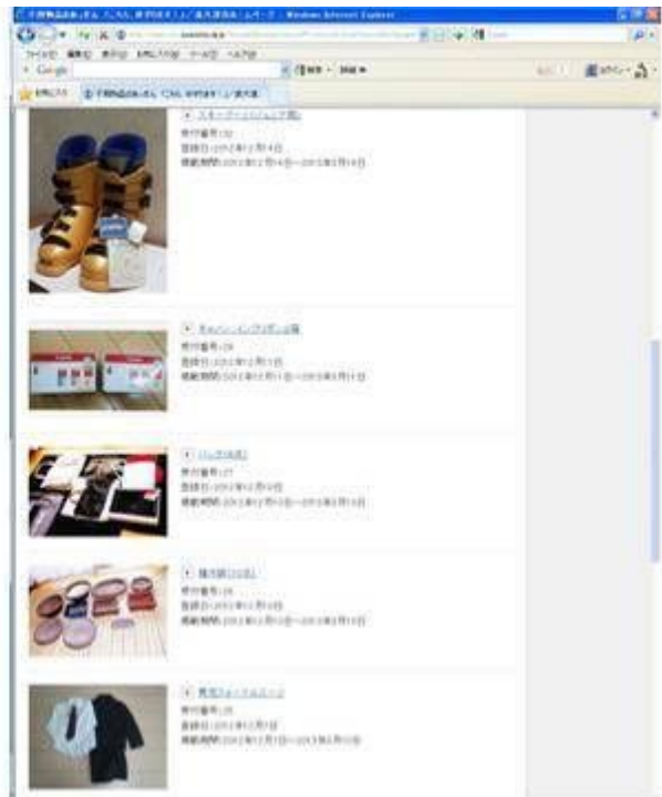
< 出品内容（例） >