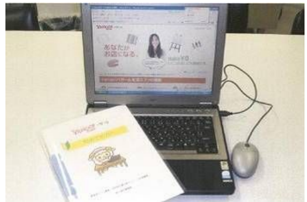
< 登録支援のマニュアル >