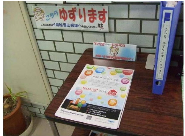
< 「Yahoo! バザール」のちらし >