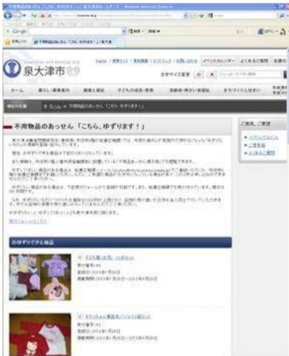
< 不用品あっせん掲示板（トップページ） >