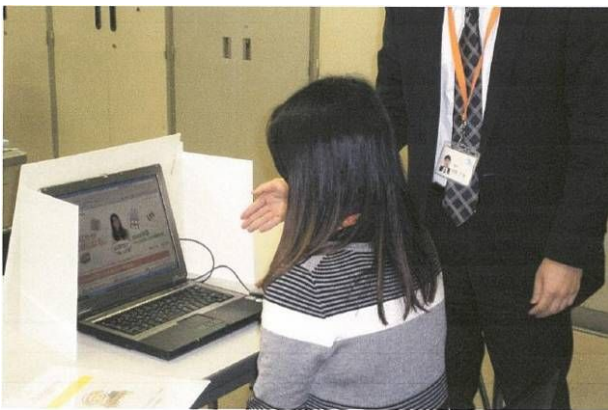
< 「Yahoo! バザール」の登録用 PC >