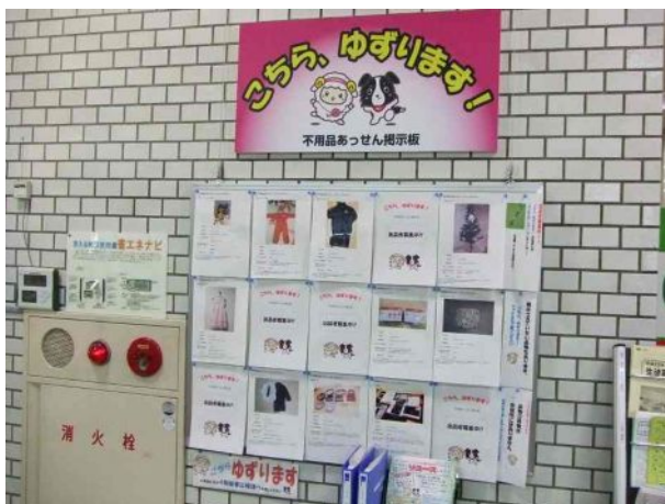
< 不用品あっせん掲示板（庁舎1階） >