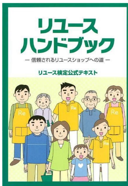
図表 8 リユースハンドブック リユース検定公式テキスト (JRAA)

まずは、2012年6月から検定を開始し、年3回実施する予定である。対象は会員企業の従業員に加え、2013年からは、JRAAの会員企業でなくても、検定を受検できるようにする予定である。