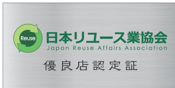
図表 7 優良店認定証（ステッカー）(JRAA)

参加した店舗からは店頭掲示することで、お客様に「安心感、信頼感」を持っていただくことが出来るとともに、従業員の意識向上にも繋がるといった意見が挙げられている。