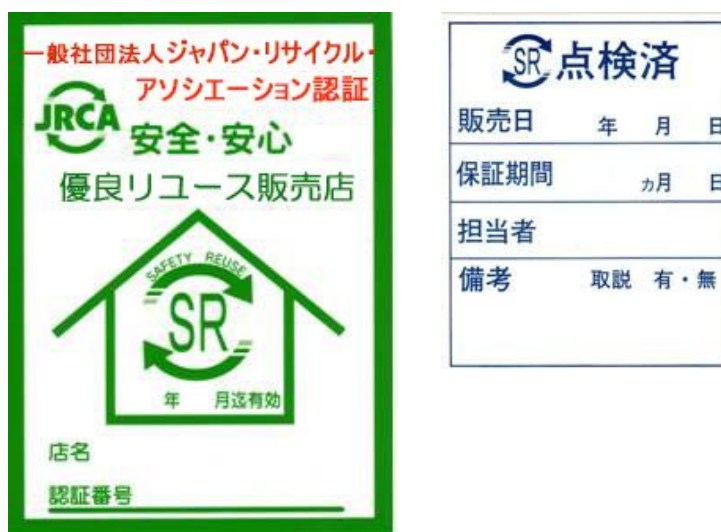
図表 3 優良リユース販売店認証制度（SR 制度）(JRCA)

今後は新たに全国版の「SR カード」を作り、全国の SR マーク認証の店舗で「SR カード」を提示すると特典があるというシステムを通じて、SR 制度の一般消費者への更なる浸透を目指す。