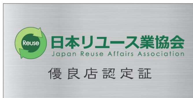
図表 7 優良店認定証（ステッカー）(JRAA)

参加した店舗からは店頭掲示することで、お客様に「安心感、信頼感」を持っていただくことが出来るとともに、従業員の意識向上にも繋がるといった意見が挙げられている。