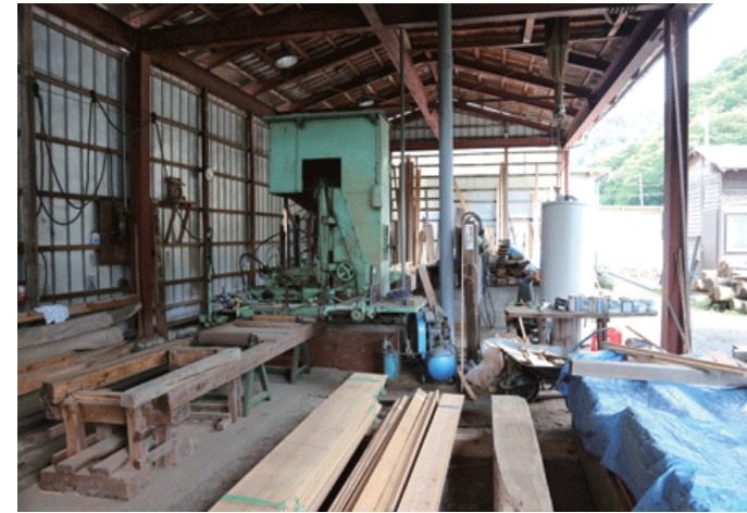
都留市の製材工場