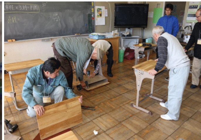
全校の天板を設置するフォーラムメンバーの地元の大工さん達