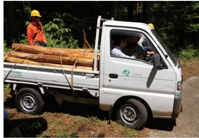
嵐山から搬出される杉の間伐材