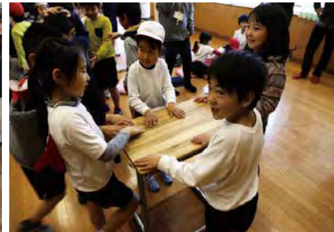
小学校の天板80枚を設置