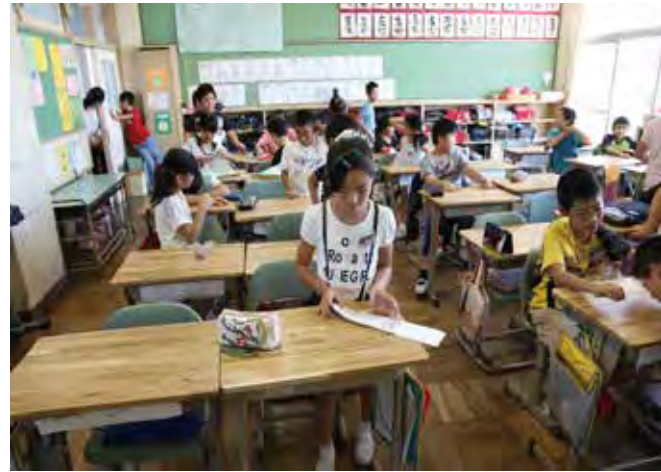
小学校4年生のクラスに取り付けられたコナラ集成材の天板