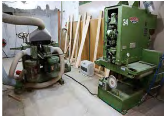
藤野に設置した集成材工場