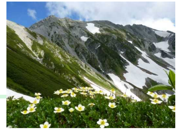
中部山岳国立公園 (1934年)