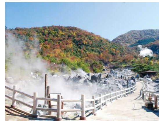
雲仙天草国立公園 (1934年)