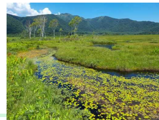
尾瀬国立公園 (2007年) 日光国立公園から分離