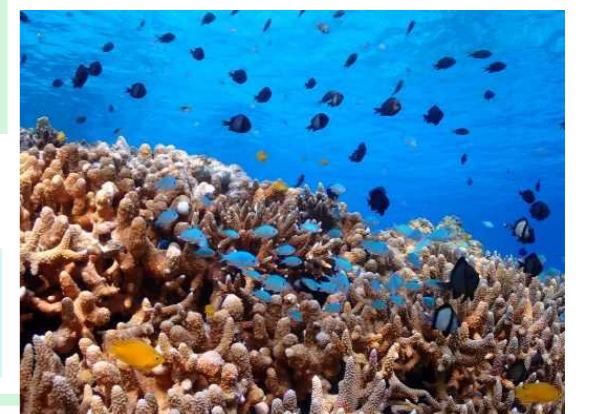
慶良間諸島国立公園 (2014年)