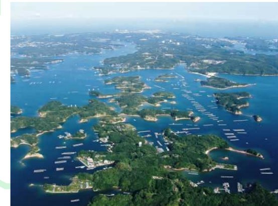
伊勢志摩国立公園 (1946年)