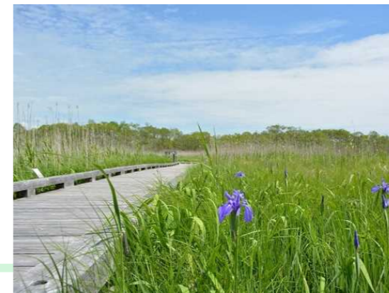
釧路湿原国立公園 (1987年)