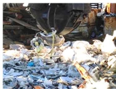
重機による洗濯機の破碎