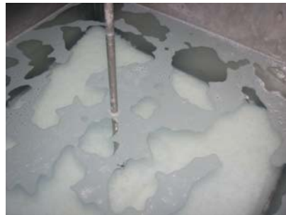
図 凝集沈殿槽における汚泥沈殿の様子