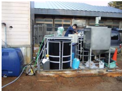
図 装置及び試験作業全景