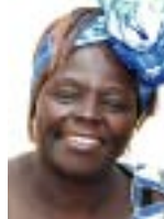
ワンガリ・マータイ ケニヤ環境副大臣