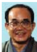
榎本 頼兼 京都市長