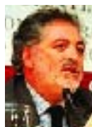
ゴンサレス・ガルシア アルゼンチン厚生環境大臣 COP10議長