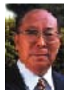
大木 浩 元環境大臣 COP3議長