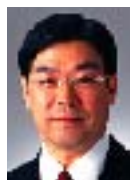
山田 啓二 京都府知事