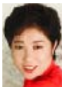
小池 百合子 環境大臣