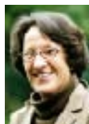
ヨーケ・ウヅミ 国連気候変動枠組条約 (UNFCCC) 事務局長