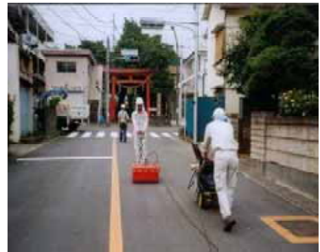
〔水平物理探査のイメージ〕

水平物理探査(レーダー探査及び磁気探査)を実施し、地下数メートルまでに異物が存在しないか調査を行います(右図のようなイメージです)。調査中は公園等の使用を制限させていただきますが、通行は可能です。