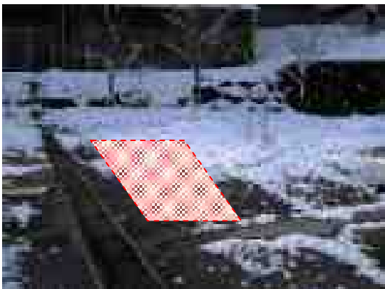
【設置場所 北側より望む】