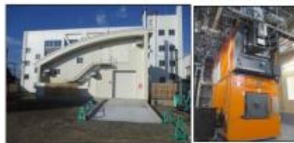
町民センターの木質バイオマスボイラー