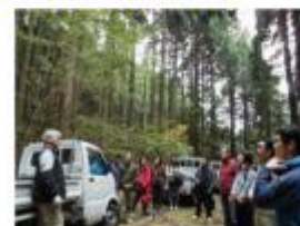
都市住民を対象とした「百年の森林」視察ツアー