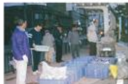
リサイクル活動「立山方式」