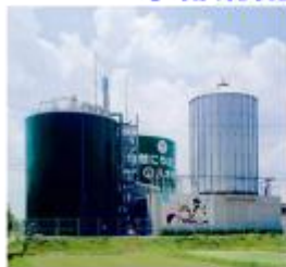
八木バイオエコロジーセンター