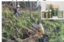
侵入竹林の伐採と「福竹茶」