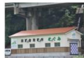
FIT認定村営小水力発電所「めぐみ」