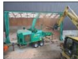
木質資源貯蔵施設