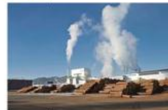
合板工場とバイオマスエネルギーセンター